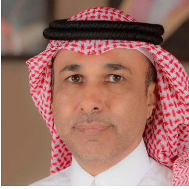
المهندس ناصر بن سليمان الناصر الرئيس التنفيذي لمجموعة stc

وتعليقاً على هذه النتائج أشار المهندس ناصر بن سليمان الناصر، الرئيس التنفيذي لمجموعة stc أن الشركة حققت أعلى إيرادات سنوية مقارنة بالثمان الأعوام السابقة، ويعود السبب بشكل رئيس إلى زيادة الطلب على خدمات الشركة المختلفة والقدرة على تلبية متطلبات العملاء بسرعة وفعالية وخصوصاً خلال جائحة كورونا. حيث ارتفعت إيرادات قطاع المستهلك مدعومةً بارتفاع مشترك الألياف البصرية بنسبة 27.5%، والنطاق العريض بنسبة 10.6%، كما ارتفعت إيرادات البيانات بنسبة 9.0% للفترة الحالية مقارنة بنفس الفترة من العام السابق (12 شهر). وكان لأداء قطاع الأعمال أثر إيجابي على النتائج، حيث نما القطاع بنسبة 24.6% خلال العام الحالي، نتيجةً لقدرة الشركة على توفير الدعم اللازم والخدمات المبتكرة لعملائها من أجل تسريع تهيئة البنية التحتية الرقمية. وعلى الرغم من التحديات التي واجهت قطاع النواقل والمشغلين بسبب إيقاف السفر وتأثيره على إيرادات التجوال الدولي إلا أن القطاع تمكن من رفع إيراداته خلال هذا العام أيضاً. كما نمت إيرادات الشركات التابعة للمجموعة بنسبة 13.8% خلال العام الحالي مما ساهم بشكل إيجابي بتحقيق هذه النتائج.