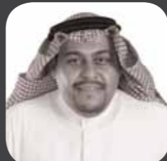
الدكتور / محمود بن عبدالكريم الخطيب نائب الرئيس للشؤون التنظيمية