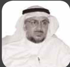
الدكتور / حمود بن محمد القاسبي نائب الرئيس لوحدة خدمات النواقل والمشغلين