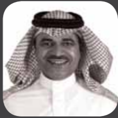
المهندس / سموذ بن ماجد الدويش الرئيس التنفيذي لمجموعة الاتصالات السعودية