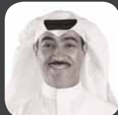
الدكتور / فهد بن حسين بن مشيط نائب الرئيس لقطاع الشؤون الاستراتيجية