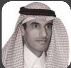
الدكتور / أمين بن فهد الشدي نائب الرئيس للشؤون المالية السعودية