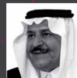
صاحب السمو الملكي الأمير نايف بن عبدالعزيز آل سعود ولي العهد نائب رئيس مجلس الوزراء وزير الداخلية