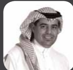
الدكتور / عبدالله بن محمد الحميدان نائب الرئيس لرأس المال البشري والتميز التنظيمي