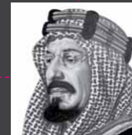
الملك عبدالعزيز بن عبدالرحمن آل سعود (رحمه الله) مؤسس المملكة العربية السعودية