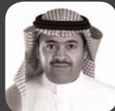
الدكتور / جميل بن عبدالله الملحم رئيس الاتصالات السعودية