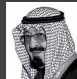
خادم الحرمين الشريفين الملك عبدالله بن عبدالعزيز آل سعود ملك المملكة العربية السعودية